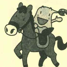
真庭市キャラクター「まにぞう」と午(うま)