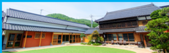
里山里海交流館しんぴお

お問合せ 電話0866-52-3009 北房まちの駅 Mail info.hokubo@gmail.com