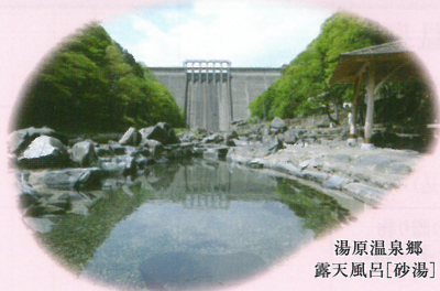
湯原温泉郷 露天風呂[砂湯]

岡山県北部、中国山脈に囲まれた森と湖といで湯のまち湯原。湯原自慢の五湯は湯原温泉郷といわれ湯原温泉・下湯原・郷緑・真賀・足温泉の五つからなり、ゆったりとしたくつろぎのひとつきを過ごすことができます。この自然豊かな湯原の温泉水を使用した濃縮温泉水とうるおい肌水をぜひお試しください。