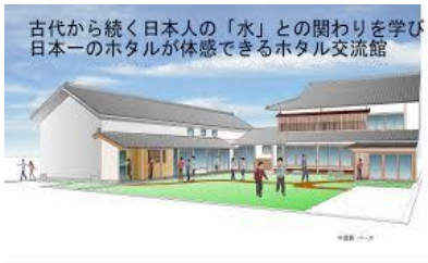
古代から続く日本人の「水」との関わりを学び日本一のホタルが体感できるホタル交流館