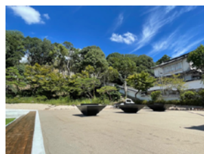
写真は「津山ピンポン広場」

森の芸術祭2027に向けて、常設作品の残る城下スクエアにてマルシェやアートイベントに立ち寄ります。森の芸術祭2027がここから始まります。