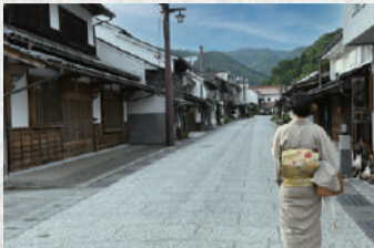
勝山町並み保存地区