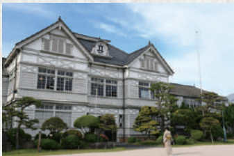
旧遷喬尋常小学校