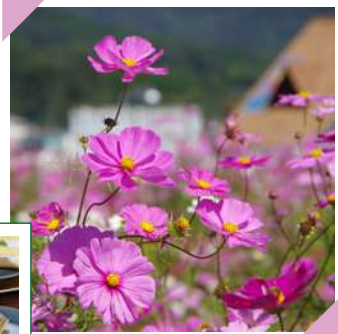
県内でも有名なコスモスの名所!