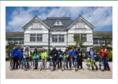
国指定重要文化財、明治40年建築の木造校舎