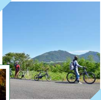
雄大な景色を眺めながら爽快なサイクリング!